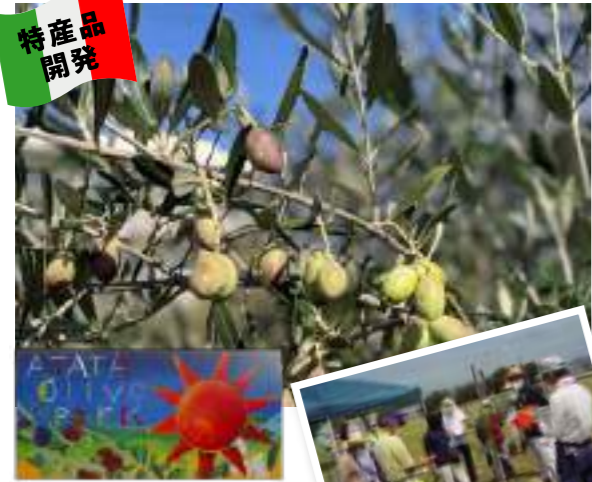
平生中学校総合文化部のみなさん作成の看板